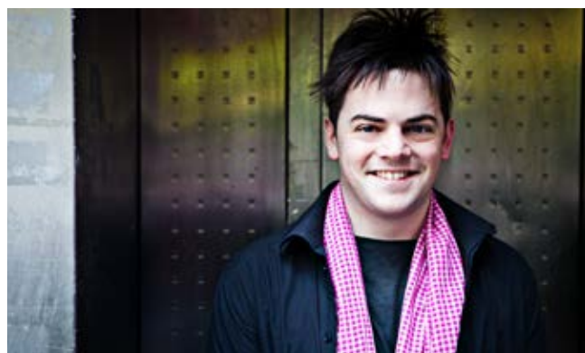
Nico Muhly