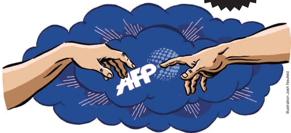
Illustration Josh Neufeld

1 semaine de création en partenariat avec l'AFP